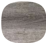
←北米の高地で使われていた銀鼠色の古い板材