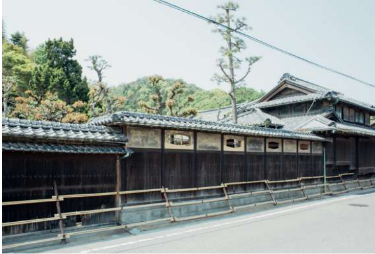
八木商店本店資料館 http://yagishoten-honten.jp/

今治は、瀬戸内海の良港として古くから繊維業や造船業で栄えてきた歴史豊かな町です。藤高タオルでは、築100年の「八木商店本店」を歴史資料館として公開するなど、今治の歴史保存活動にも取り組んでいます。