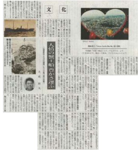
「人情の蟹工船 豊かさ運ぶ」 (日本経済新聞 6月21日掲載)