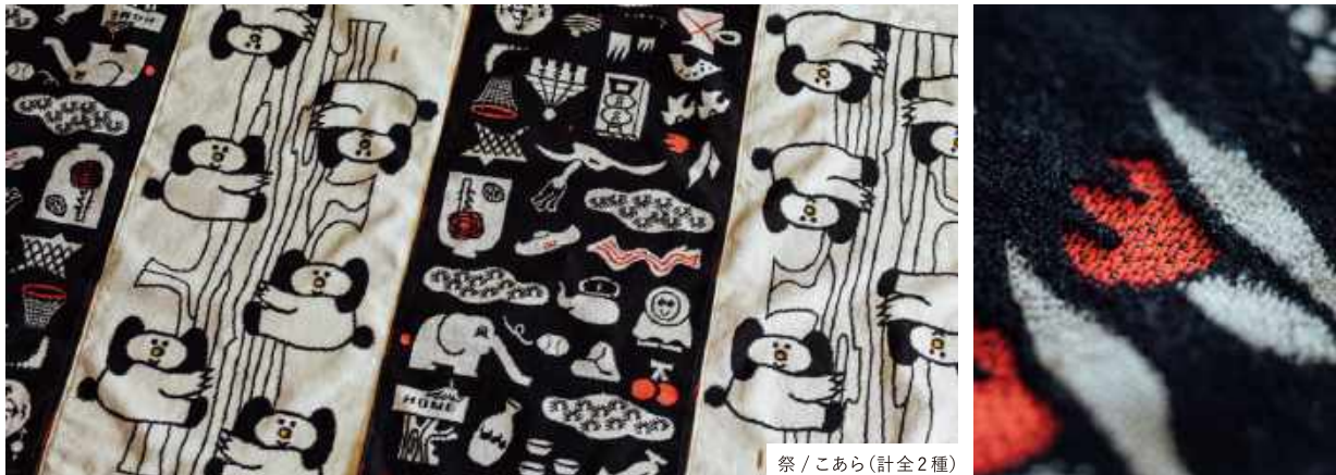
祭 / こあら (計全2種)

※JAGDAとは…公益社団法人日本グラフィックデザイナー協会(略称JAGDA)は、現在、会員数約3,000名を誇るアジア最大規模のデザイン団体です。毎年、今後の活躍が期待される有望なグラフィックデザイナーに「JAGDA新人賞」を贈り、デザイナーの登竜門として、第一線で活躍する113名のデザイナーを輩出し、注目を集めています。