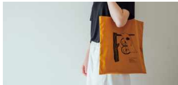
写真左) ハンドタオル: チューリップ / オアシス / 病み上がり時計 / 花瓶 / 花とアリ / こあら / 四つのりんご / すずらん / りんご / モーション / とらと花瓶 (計全11種) 写真右) トートバック